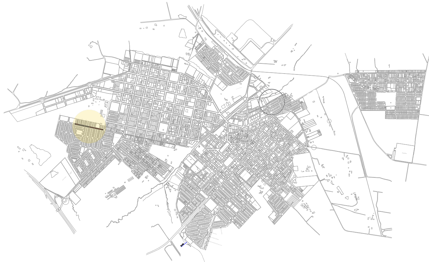
LOCALIZAÇÃO SEM ESCALA