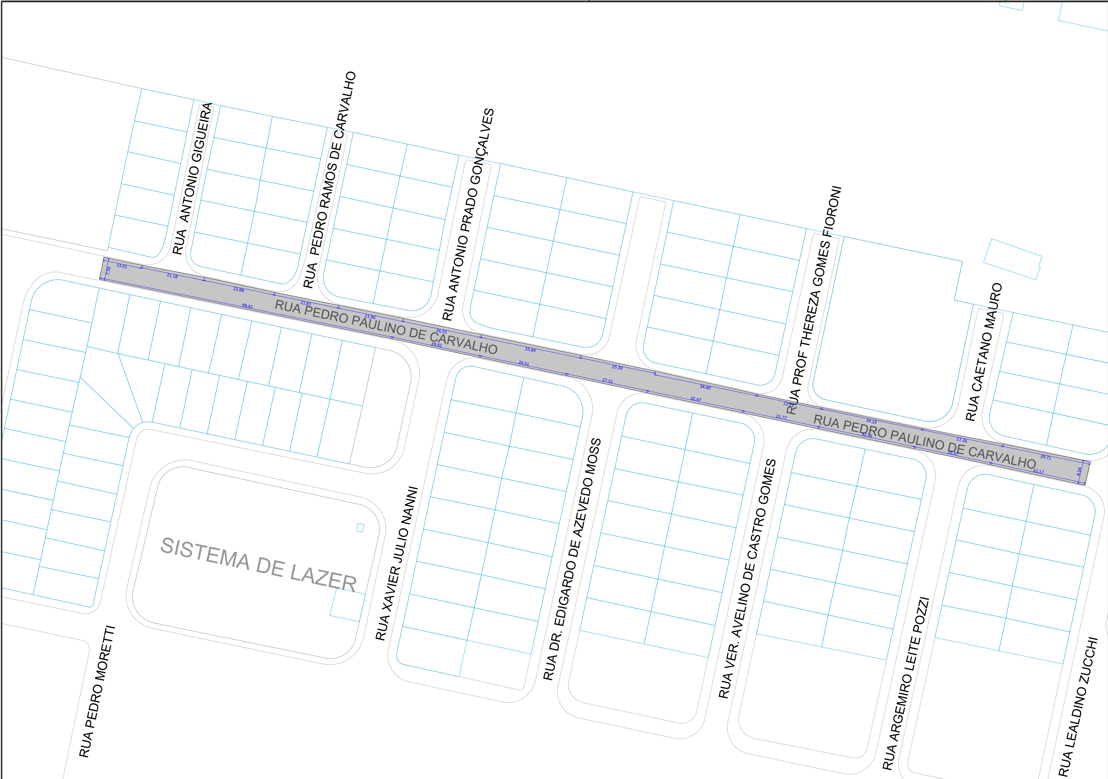
PROJETO DE RECAPEAMENTO RUA PEDRO PAULINO DE CARVALHO ESCALA: 1:750